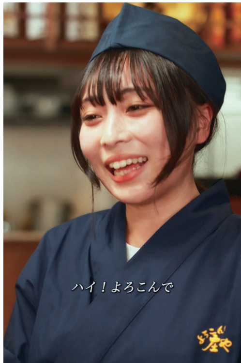
▲ショートドラマ「コトバノチカラ」

庄やでは、2025年12月よりショートドラマの配信を開始いたしました。現在までに5作品を公開し、TikTok・Instagram・YouTubeを通じた総再生回数は2,300万回（2026年4月30日現在）を突破するなど、多くの方にご覧いただいております。本取り組みは、庄やが大切にしてきた「ぬくもり」や「人と人のつながり」を、物語として伝えることを目的としています。これまでのSNS施策では表現しきれなかった店舗の空気感や、板前・スタッフの想いを映像として可視化することで、庄やを知らない方には新たな接点を、しばらく離れていた方には思い出していただく機会を創出しております。実際に視聴者からは多くの共感の声が寄せられ、幅広い世代へと認知が広がっています。株主の皆様におかれましても、ぜひ動画をご覧ください、本取り組みへのご理解とともに、今後の展開にご期待いただけますと幸いです。