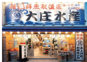
▲『大庄水産』橋本店の店頭