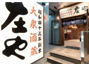
▲『庄や』南浦和店の店頭