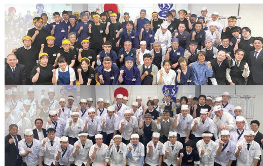
▲多くの店長・調理長がインセンティブを獲得

店長・調理長業務を担う社員を対象に、在籍店舗の年間営業利益に応じて報奨金を支給するインセンティブ制度は、今期で10年目を迎えました。制度の広がりとともに受賞者は着実に増加し、初めて報奨金を手にする社員も増えています。日々の取り組みが成果として評価されることで、現場の意欲と挑戦を後押ししています。人手不足が課題となる中でも、人材を大切にする仕組みにより、現場力を高め、安定した店舗運営とさらなる成長につなげています。