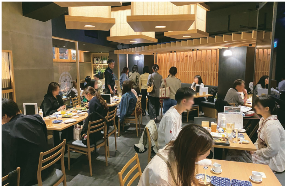
▲連日賑わいを見せる『お魚総本家』銀座店の様子