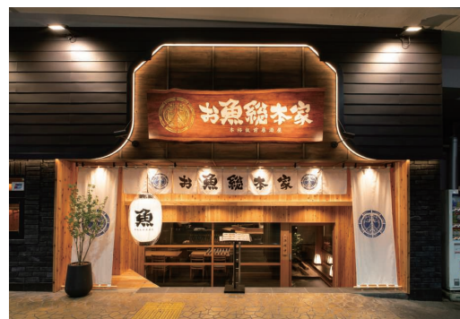
▲『お魚総本家』銀座店の店頭

2025年12月17日、本格板前居酒屋『お魚総本家』の6店舗目となる銀座店がオープンしました。美食と文化が集まる銀座への満を持しての出店です。「腕に、魚に、こだわり抜く」をコンセプトに、全国の漁港から毎日届く40種以上の鮮魚を最適な調理法で提供。特にガラス張りの店頭から見える、板前による豪快な「藁焼き」の炎は、道行く国内外のゲストの好奇心を強く誘います。看板メニューの「かつお藁焼き」は、目の前で上がる炎と芳醇な香りが五感を刺激する、まさに「必食」の逸品です。ライブ感あふれる演出と一流のおもてなしを通じて、日本の居酒屋文化の魅力を世界へと発信し、洗練された大人のための格別な食体験を届けます。