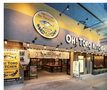
▲『オートロキッチン』静岡駅前店