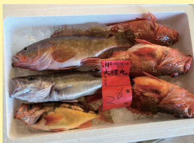
▲糸魚川漁港に水揚げされた新鮮な魚