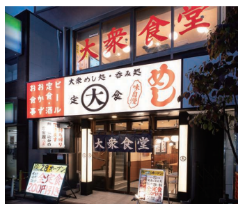
▲『定食のまる大』矢口渡店

マグロ専門業態『オートロキッチン』が、11月1日に東京都北区・赤羽へ出店。さらに、12月9日には5店舗目となる静岡駅前店をオープンし東京都外へ初進出を果たしました。食事メイン業態『定食のまる大』は、10月28日に東京都大田区へ矢口渡店を、4月10日には埼玉県鴻巣市へ進出し、7店舗となりました。当社は今後も、多様な食のニーズに応えるための機動的な出店を継続してまいります。