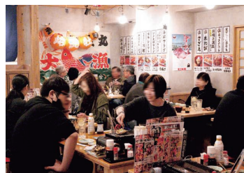
▲『大庄水産』京急鶴見店 店内の様子