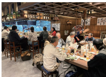
▲『庄や』南浦和店 店内の様子