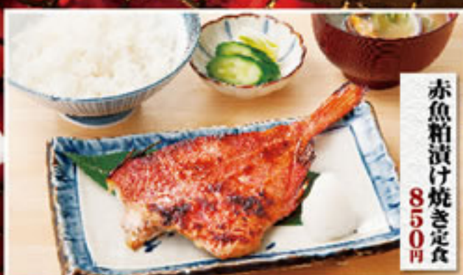
赤魚粕漬焼き定食 850円