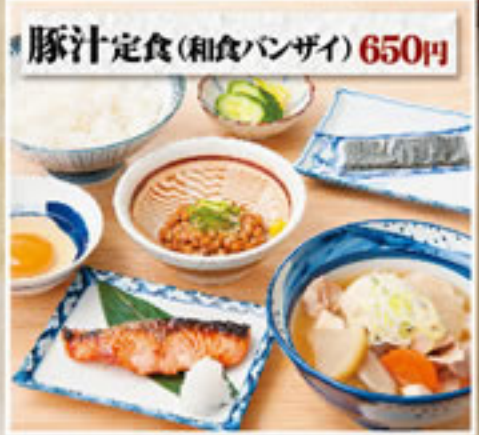
豚汁定食(和食パンザイ) 650円