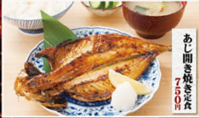
あじ開き焼き定食 750円