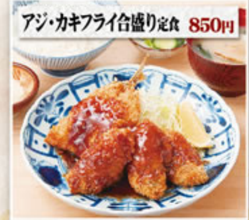
アジ・カキフライ合盛り定食 850円