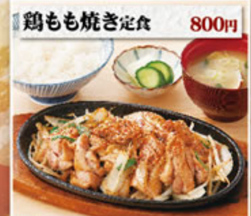
鶏もも焼き定食 800円