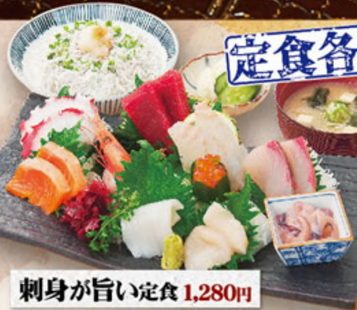
刺身が旨い定食 1,280円