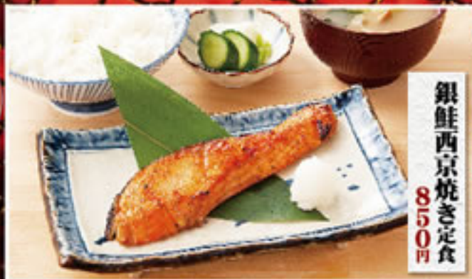
銀鮭西京焼き定食 850円