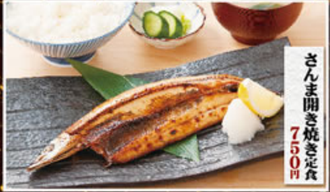
さんま開き焼き定食 750円