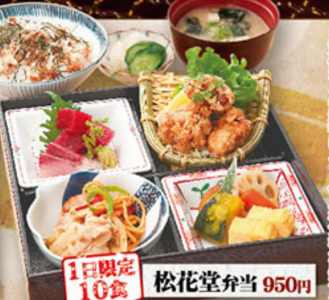
1日限定 10食 松花堂弁当 950円