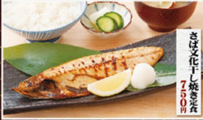
さば文化干し焼き定食 750円