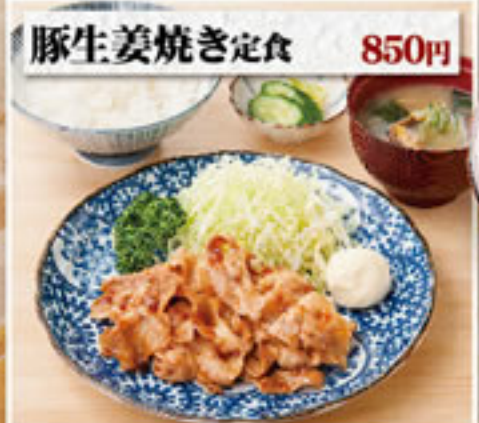
豚生姜焼き定食 850円