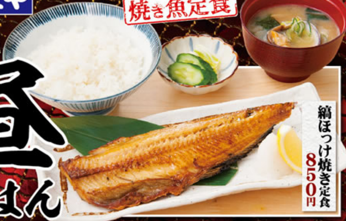
鱈ほつけ焼き定食 850円