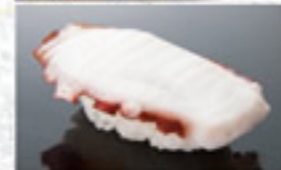
茹たこ 150円 Boiled Octopus