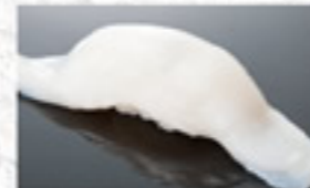
活たこ 150円 Octopus