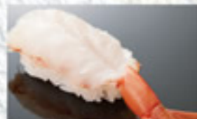
ぼたん海老 400円 Jumbo Shrimp