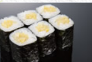
かっぱ巻 180円 Cucumber Thin Sushi Roll