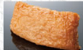
いなり 100円 Sushi Wrapped in Fried Tofu