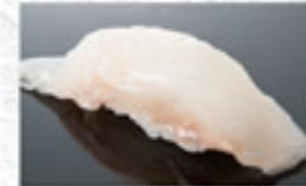
平目 200円 Flounder