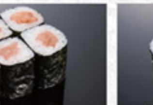
海老きゅう巻 250円 Shrimp with Cucumber Thin Sushi Roll