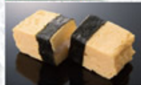
玉子 100円 Omelet