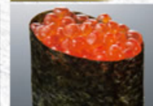
いくら 300円 Salmon Roe