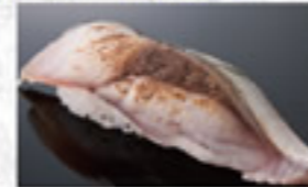
炙めさば 180円 Lightly Seared Marinated Mackerel