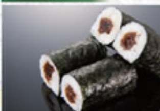
かんびょう巻 180円 Dried Gourd Shavings Thin Sushi Roll