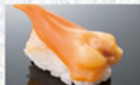
青柳 250円 Mactra chinensis (Round Clam, Yellow Clam)