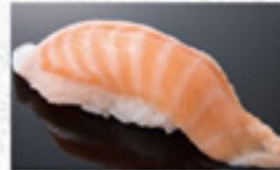
とろサーモン 180円 Fatty Salmon