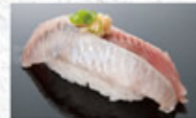
いわし 150円 Sardine