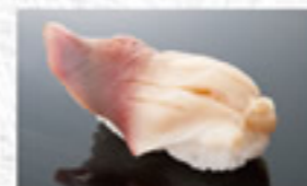
活ほっき貝 250円 Sakhalin Surf Clam