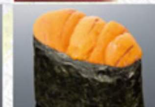
うに 500円 Sea Urchin