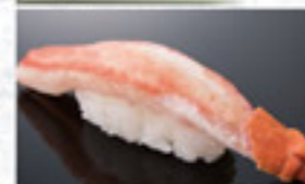
生ずわいかに 350円 Snow Crab