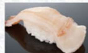
活白みる貝 250円 Japanese Geoduck