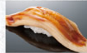
穴子 250円 Conger Eel