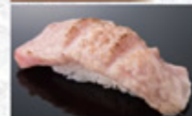
炙本鮪大とろ 450円 Lightly Seared Fatty Tuna