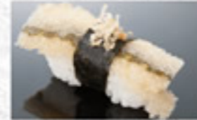
子持ち昆布 200円 Herring Spawn on Kelp