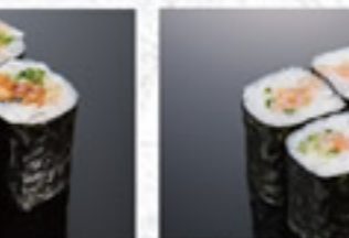
鉄火巻 350円 Tuna Thin Sushi Roll