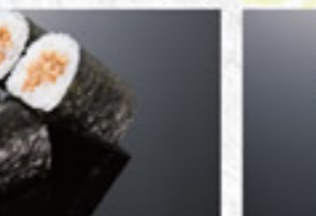
おしんこ巻 180円 Pickled Radish Thin Sushi Roll