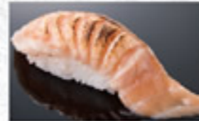
炙とろサーモン 180円 Lightly Seared Fatty Salmon