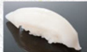
いか 150円 Squid