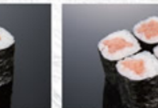
明太子巻 250円 Seasoned Cod Roe Thin Sushi Roll