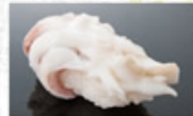
げそ 100円 Boiled Squid Tentacles