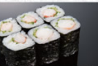
穴きゅう巻 350円 Conger Eel with Cucumber Thin Sushi Roll