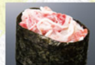
かにサラダ 100円 Crab with Mayonnaise