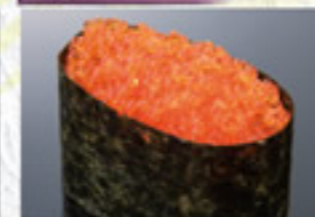
とびっ子 150円 Flying-Fish Roe