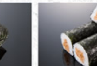
納豆巻 180円 Fermented Soybeans Thin Sushi Roll