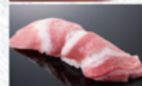
本鮪大とろ 400円 Fatty Bluefin Tuna