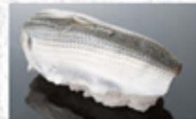
こはだ 150円 Medium - Sized Gizzard Shad