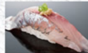
あじ 150円 Horse Mackerel