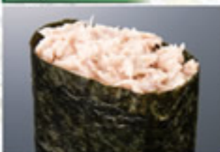
ツナサラダ 100円 Tuna with Mayonnaise