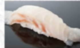
真鯛 200円 Sea Bream