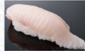
とろはまち 230円 Fatty Yellowtail