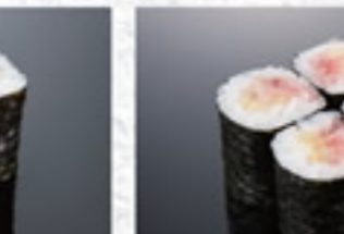
とろたく巻 350円 Mashed Tuna with Green Onions & Pickled Daikon Radish Thin Sushi Roll