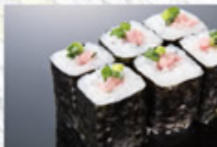
ねぎとろ巻 350円 Mashed Tuna with Green Onions Thin Sushi Roll