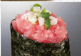
ねぎとろ 200円 Mashed Tuna with Green Onions