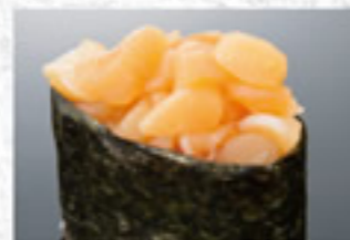
小柱 200円 Small scallop