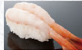
甘海老 150円 Sweet Shrimp