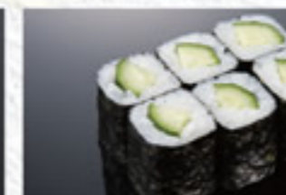
梅しそ巻 180円 Pickled Plum with Perilla Thin Sushi Roll