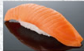
サーモン 150円 Salmon