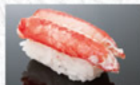
茹ずわいかに 250円 Boiled Snow Crab