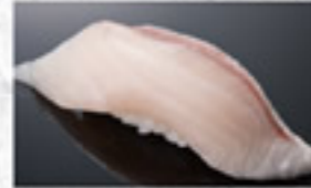
かんばち 200円 Greater Amberjack