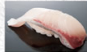
はまち 150円 Yellowtail