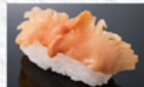
活赤貝 400円 Ark Shell