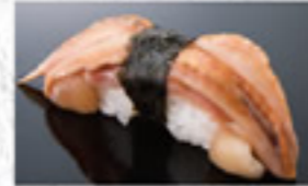
赤貝ひも 200円 Mantle of Ark Shell