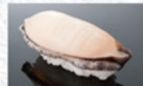
活あわび 400円 Abalone