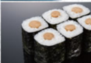
ごぼう巻 250円 Burdock Root Thin Sushi Roll