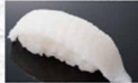
えんがわ 200円 Flounder Edge