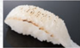
炙えんがわ 230円 Lightly Seared Flounder Edge