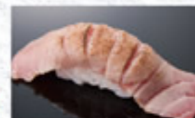
炙本鮪中とろ 350円 Lightly Seared Medium Fatty Tuna