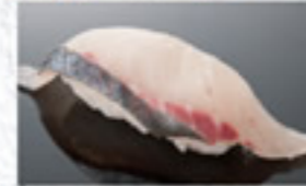
しまあじ 250円 Striped Jack