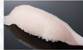
とろかんばち 230円 Fatty Greater Amberjack