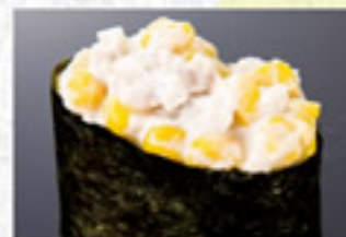
ツナコーンサラダ 100円 Tuna & Corn with Mayonnaise