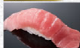
本鮪中とろ 300円 Medium Fatty Bluefin Tuna