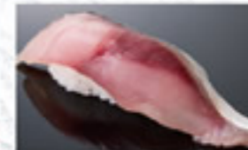
めさば 150円 Marinated Mackerel