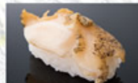
活つぶ貝 400円 Whelk