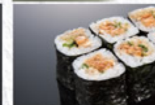
ひもきゅう巻 350円 Mantle of Ark Shell with cucumber Thin Sushi Roll