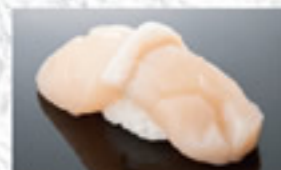
帆立 250円 Scallop