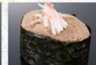
かにみそ 150円 Tomalley(Crab Butter)