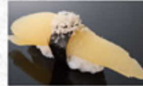
数の子 200円 Herring Roe