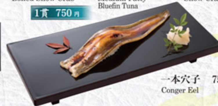
一本穴子 750円 Conger Eel