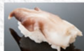
とり貝 250円 Cockle