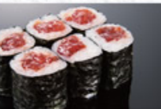
とろ鉄火巻 500円 Fatty Tuna Thin Sushi Roll