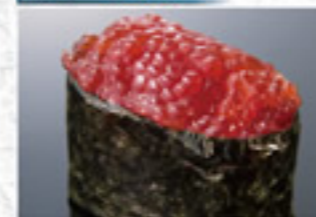
すじこ 250円 Salmon Roe