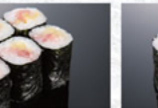
すじこ巻 350円 Salmon Roe Thin Sushi Roll