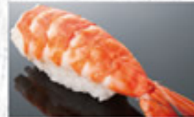
海老 150円 Shrimp