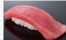
本鮪赤身 200円 Bluefin Tuna