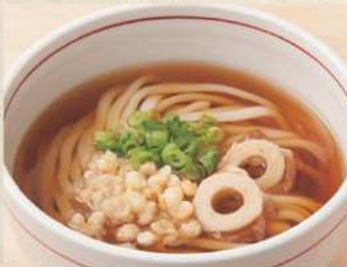
かけ 温 350円