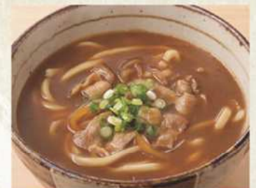
カレー南蛮 温 680円

トッピング ●温泉玉子 80円 ●生玉子 50円 ●すだち 100円 ●納豆 100円 ●白ごま 無料 ●削り節 無料 ●ゆず粉 無料