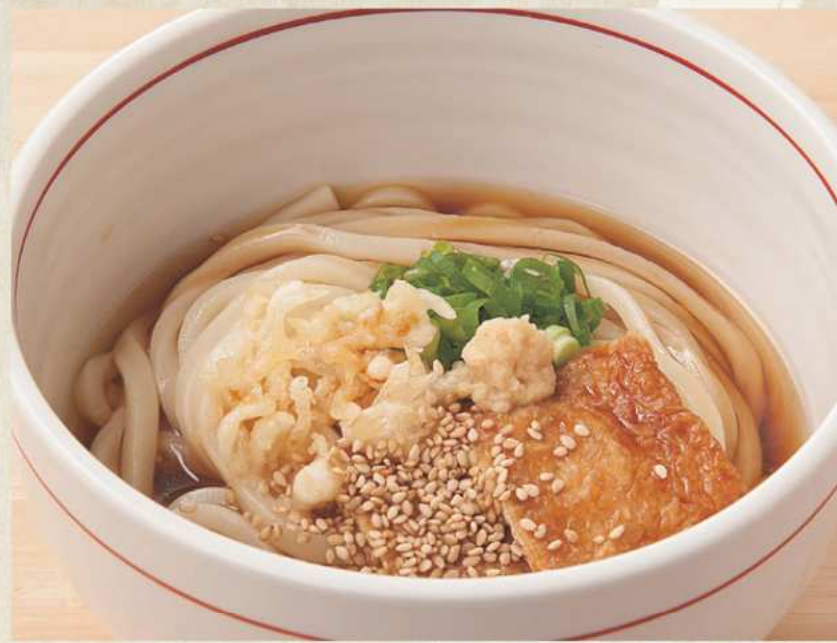
ぶっかけ 冷 400円