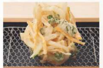
野菜のかき揚げ 250円