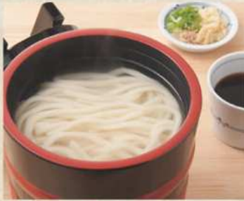
釜揚げ 温 450円