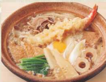
鍋焼き 温 750円