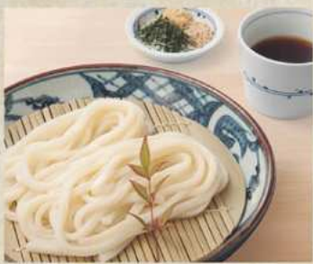
ざる 冷 400円