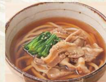
肉 温 600円