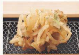
あさりのかき揚げ 350円