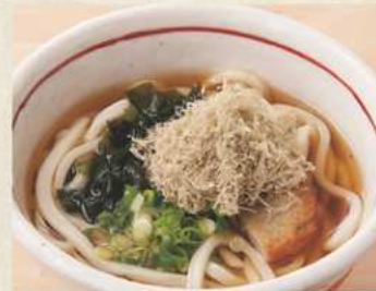
岩(おぼろ・わかめ) 温 450円