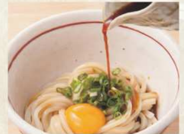
釜玉 温 450円