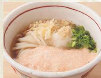
ももゆき 温 または 冷 600円