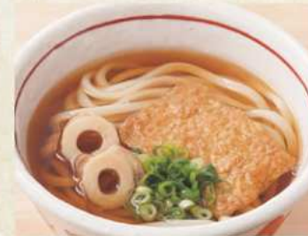
きつね 温 または 冷 450円