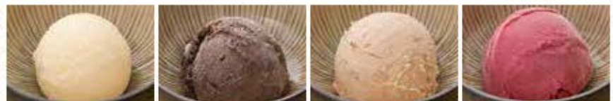
バニラアイス チョコレートアイス 本日のアイス 季節のシャーベット