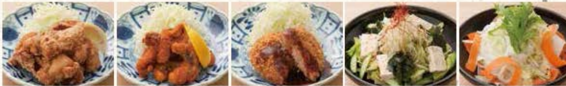
鶏の唐揚 たこ唐揚 粗びきメンチカツ わかめと豆腐の チャレギサラダ なまゆ 紐皮野菜の さっぱりサラダ