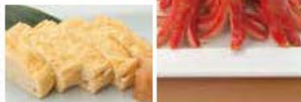
みんな大好き玉子焼き 赤ワインナー