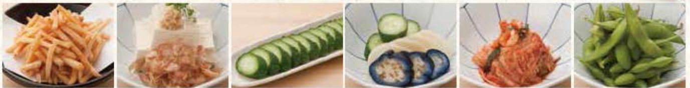
フライドポテト 冷奴 胡瓜一本漬 漬物盛合せ 白菜キムチ 枝豆