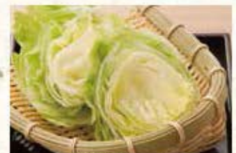
ひまわり 瑞々レタス