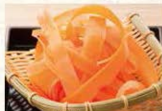
ひまわり 紐皮人参