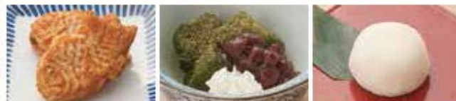
ミニたい焼き 抹茶わらび餅 雪見大福