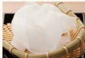
ひまわり 紐皮大根