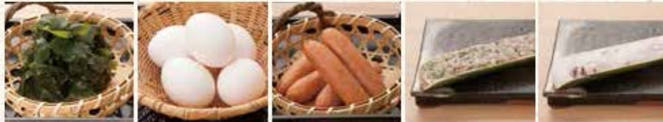
わかめ 生卵 ソーセージ 竹筒鶏つまれ 竹筒海鮮つまれ