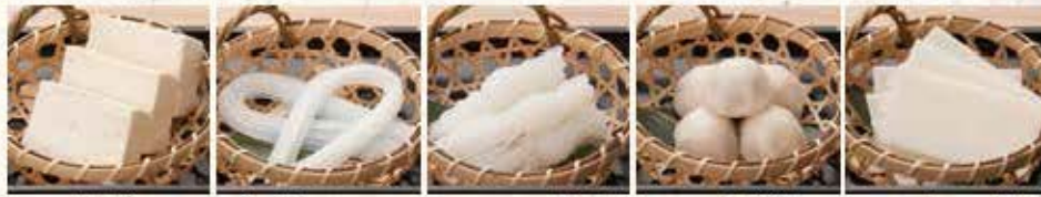
お豆腐 定番マロニー ヘルシー糸海苔 一口水餃子 しゃぶしゃぶ餅