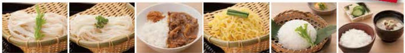
きしめん 縮庭うどん 名物肉屋のカレー ラーメン 雑炊セット ごはんセット