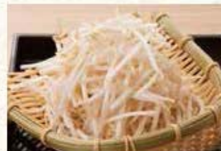
しやしやしきもやし