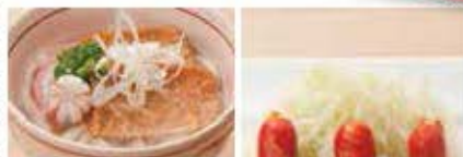
ミニうどん(温・冷) 赤ワインナー