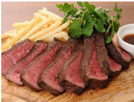
ビーランプキャップ 約180g～ 1,450円～

「神田の肉バル RUMP CAP」は、その店名にもある牛1頭から僅か4kg程しかとれない超希少部位「ランプキャップ」はじめ、「アウトサイドスカート（ハラミ）」「フラップミート（カインノミ）」「T ボーンビーフ」「ビーフハツ（数量限定）」などのオリジナル肉料理をリーズナブルな価格で提供します。