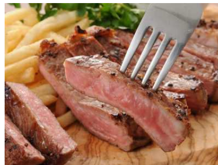
ビーフサーロイン 約 180g～ 1,650 円～

メニューの最大の特徴は、超希少部位のランプキャップ。さらに、アウトサイドスカート（ハラミ）、サーロイン、フラップミート（カイノミ）などの部位も品揃えし、それぞれ、180g、230g、460gとお好みでのオーダーを可能としています。敢えて熟成肉は使わず、肉本来の旨みをストレートに味わっていただきます。これらに加え、ビーフハツ炙り（数量限定）やTボーンビーフなど“がつつり”肉を食べたい肉好きに魅力的なメニューの数々を用意しています。