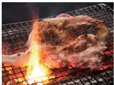
豪快に1本丸ごと炙り焼く「骨付きもも焼き」680円(税別)