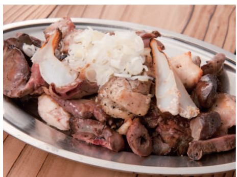
お薦め部位6種を盛り合わせたお得な「ミックス焼き」680円(税別)