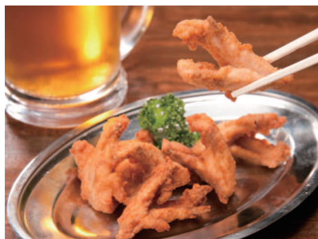
1羽から1つのみの部位「勝利の唐揚げ(Vチキン)」420円(税別)

酒類は、「旨い鶏肉」をより旨く食すために考えた、酒好きが気楽に楽しめるラインアップ。