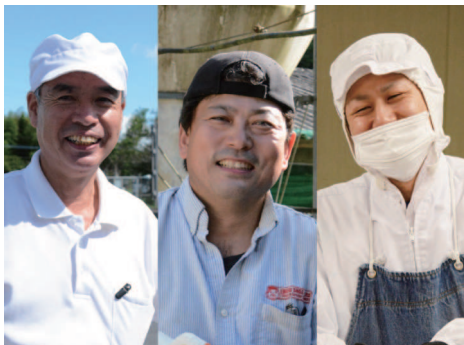
宮崎県都城市の生産者と大自然の飼育環境

その理由は、宮崎の生産者が現地で加工した鶏肉を空輸で直接仕入れ、加工から1日以内でお客様に提供するなど鮮度が良いことはもちろん、ストレスのない宮崎の自然豊かな環境で、霧島連山からの霧島裂罅水(きりしまれっかすい)と呼ばれるミネラルたっぷりの天然地下水を飲んで育った、生後49日の若々しい「若鶏」だから。臭みのない若鶏ならではの脂の甘さやコク、みずみずしさ、程よく締まった身のプリプリとした弾力が味わえます。