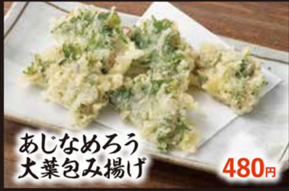
あじなめろう 大葉包み揚げ