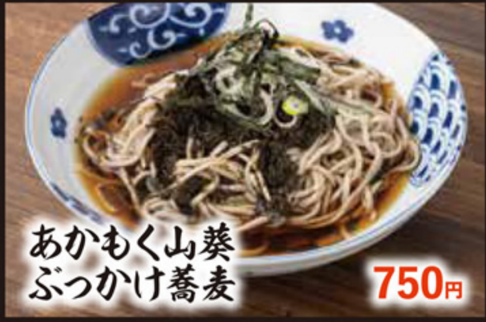
あかもく山葵 ぶっかけ蕎麦