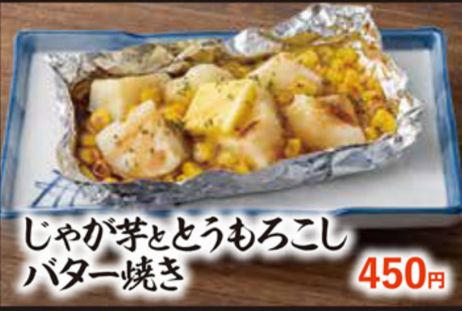
じゃが芋ととうもろこし バター焼き