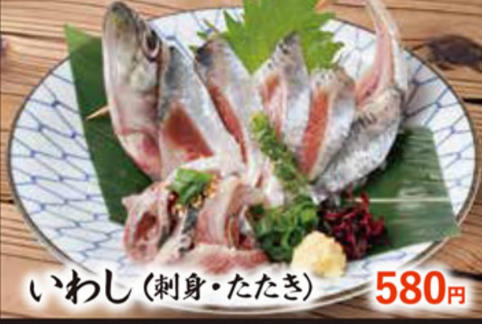
いわし (刺身・たたき)