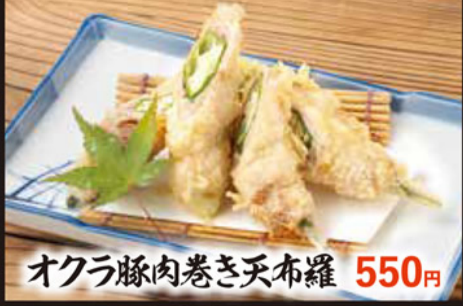
オクラ豚肉巻き天布羅