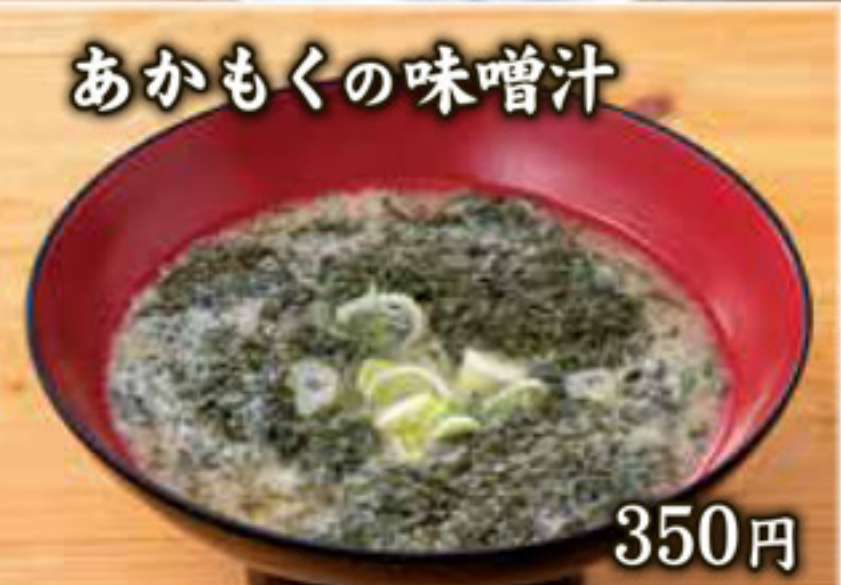
あかもくの味噌汁 350円