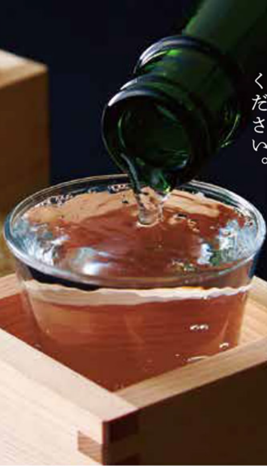
写真はイメージ(実際の酒器と異なる場合があります)

各地の気候や風土、歴史に根ざした食と酒を大切にする「築地日本海」。多くの蔵元と強い絆を結ぶ私たちは、地域を代表する酒蔵の銘柄を紹介してまいります。ぜひ、ご賞味ください。