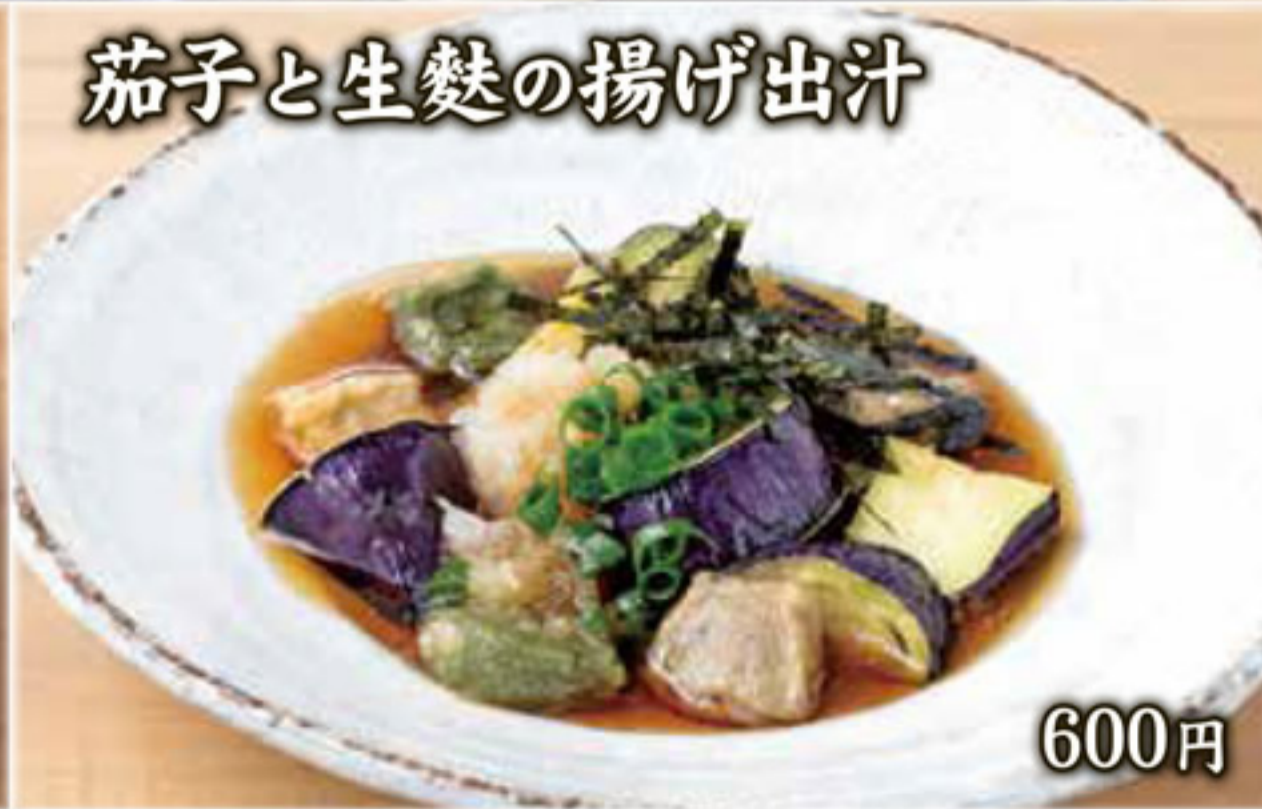
茄子と生麩の揚げ出汁 600円