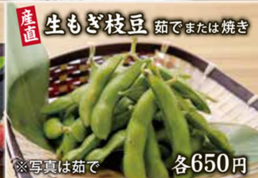
産直 生もぎ枝豆 茹でまたは焼き 各650円