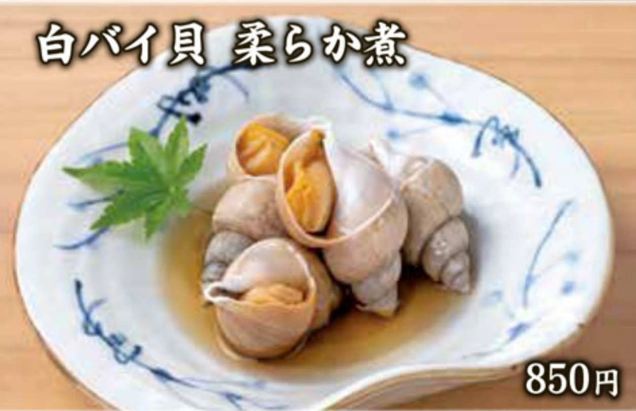
白パイ貝 柔らか煮 850円