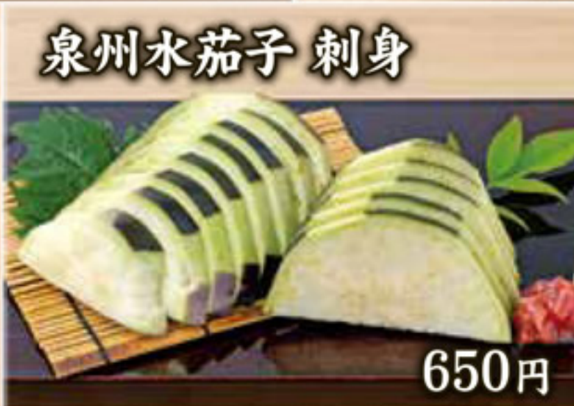
泉州水茄子 刺身 650円