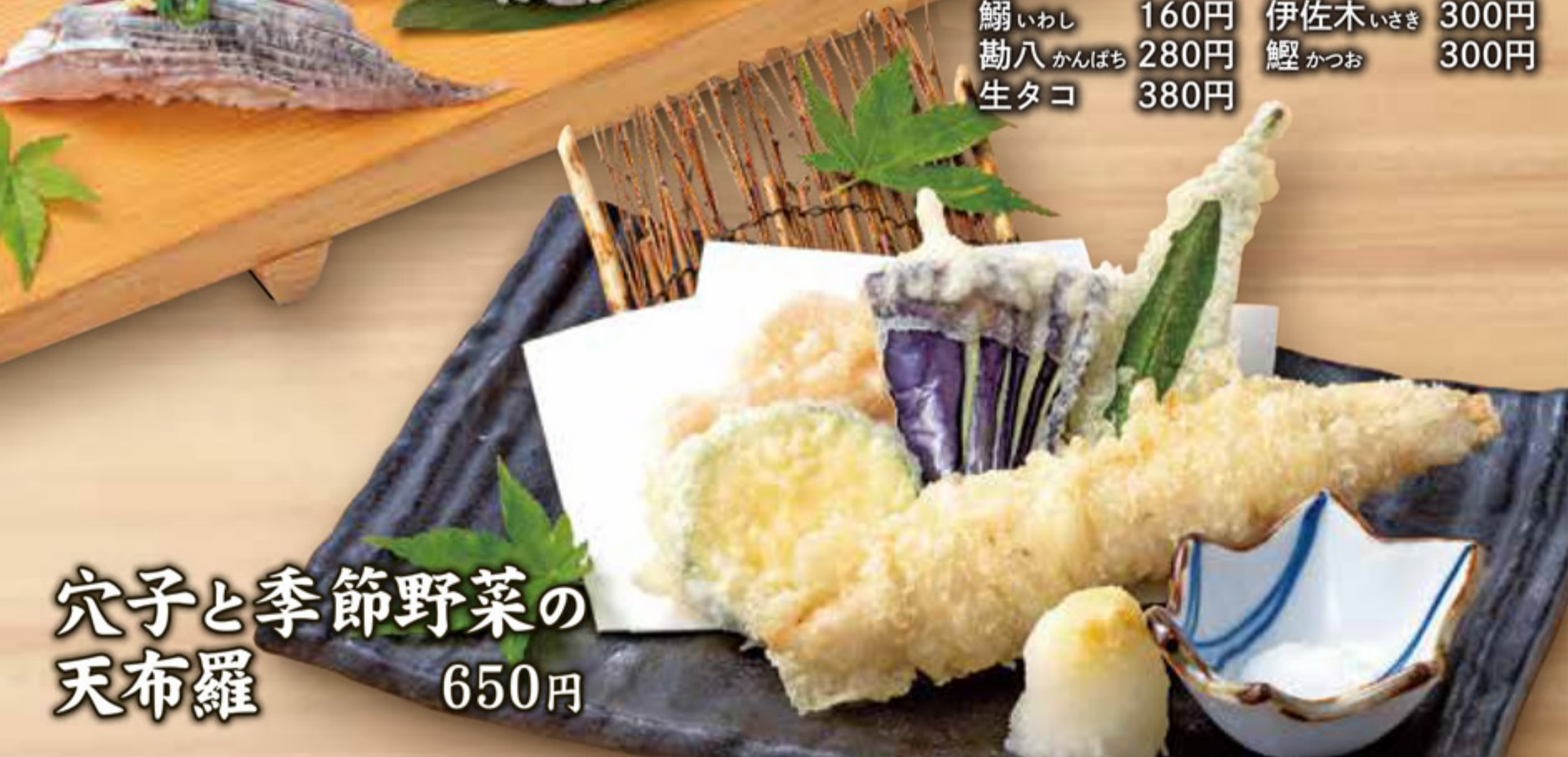
穴子と季節野菜の天布羅 650円