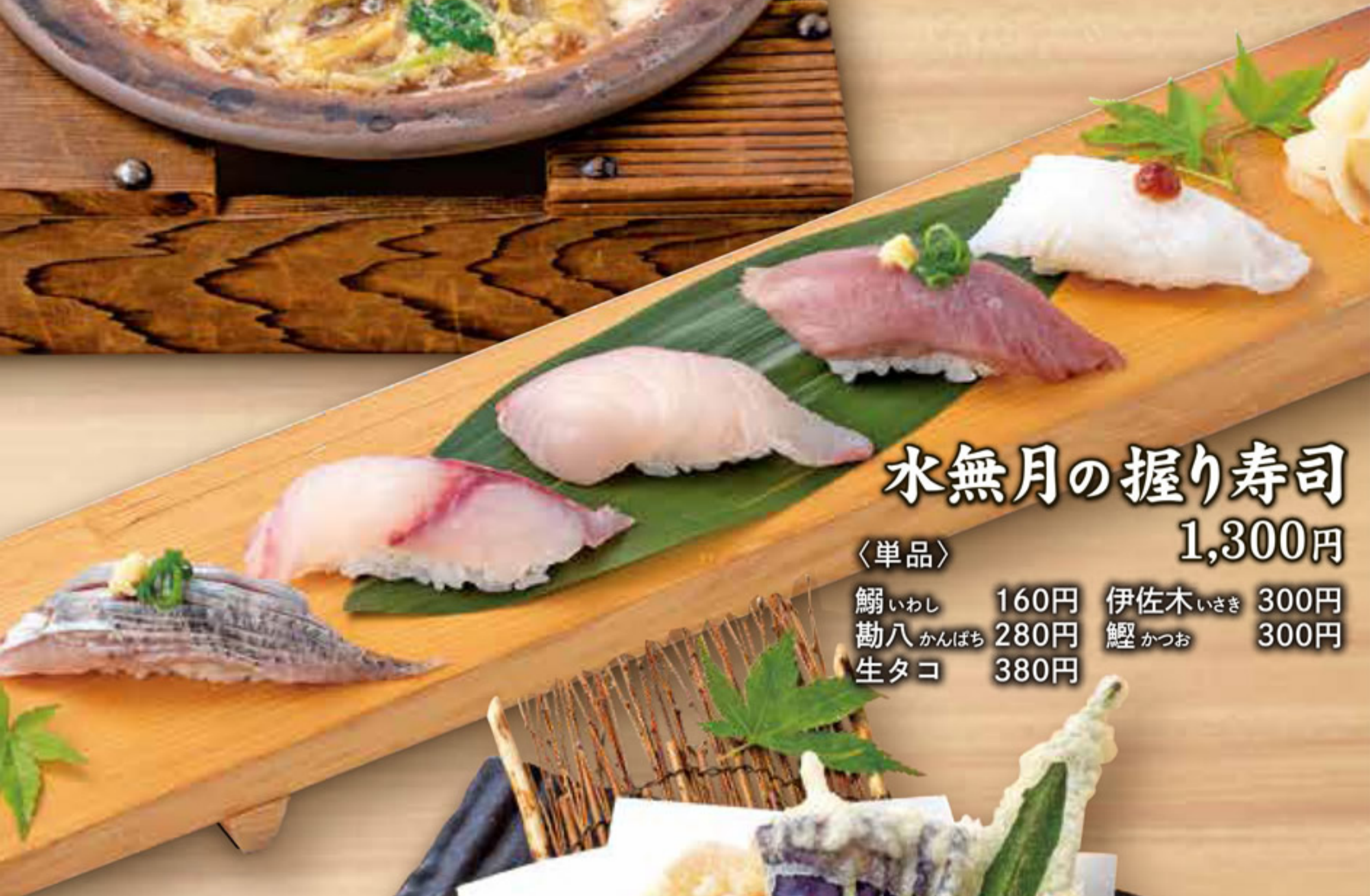
水無月の握り寿司 1,300円