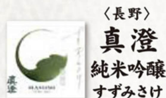
〈長野〉 真澄 純米吟醸 ずずみさけ