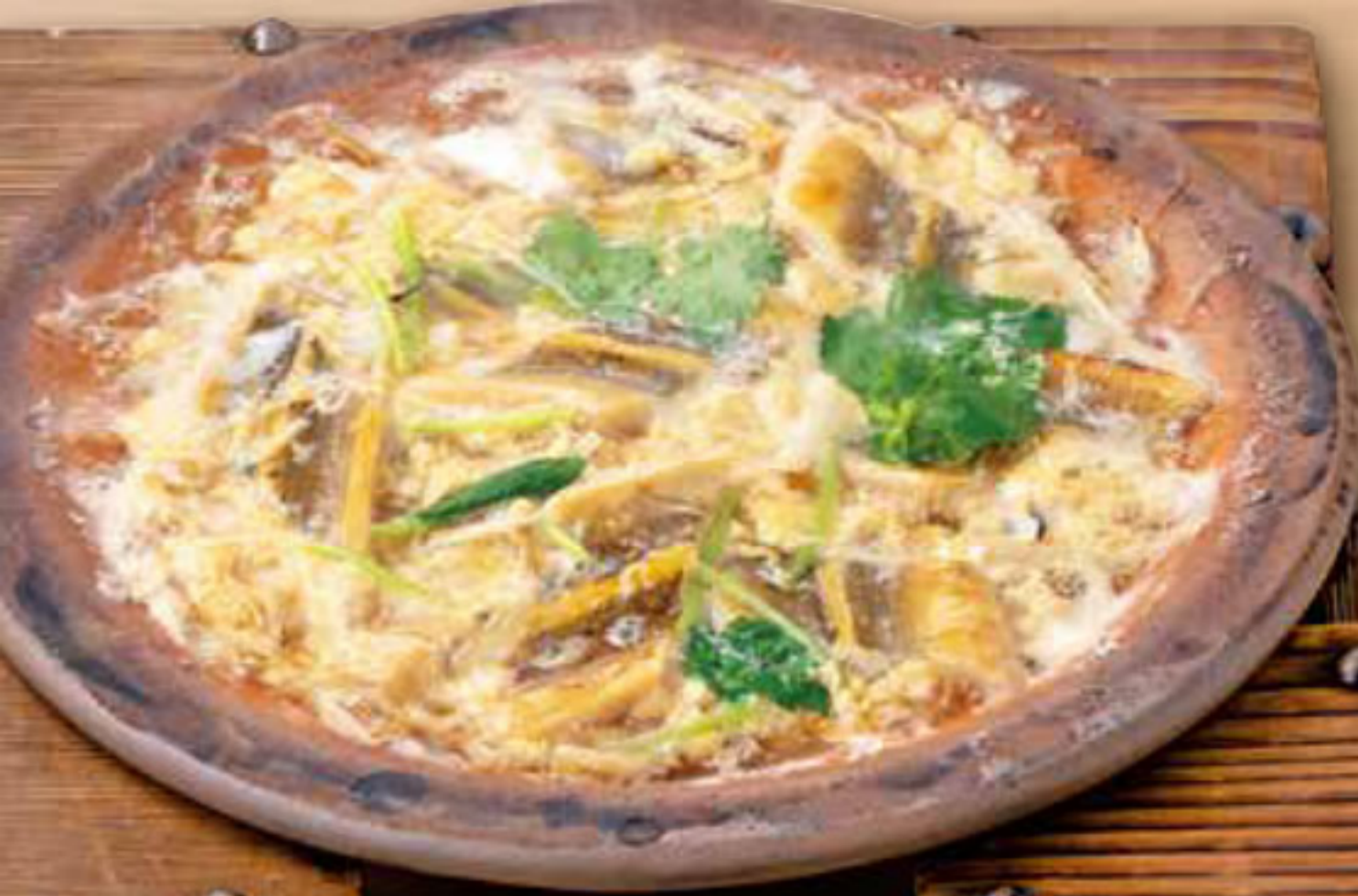
穴子柳川 小鍋 880円